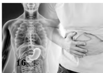
16 Правильное питание - профилактика опухолей ЖКТ