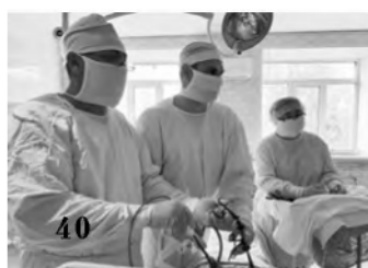
40 Рядом, когда нужна ваша помощь

81 ГОД ВЕЛИКОЙ ПОБЕДЫ! Медики всегда на передовой... ..... 1 Алтайский краевой госпиталь для ветеранов войн отметил 80-летие! ..... 2-6