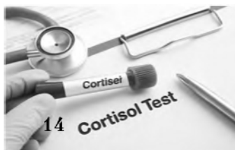
14 Кортизол: друг или враг?