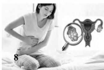
8 Синдром поликистозных яичников